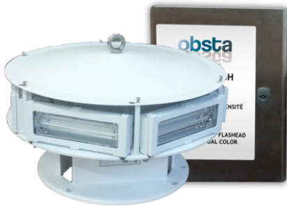
Brevets: EP 1966535B1 &amp; US 7816843