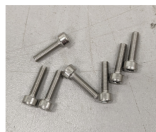
Figure 1: VIS CHC M3X12 INOX A4