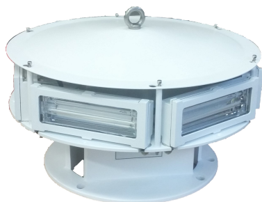
EP 1966535B1 & US 7816843