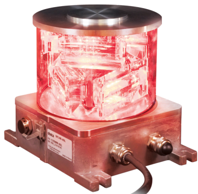
1966535B1 & US 7816843