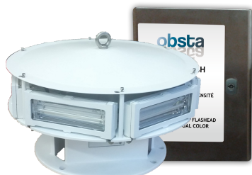
EP 1966535B1 & US 7816843