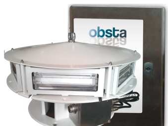
EP 1966535B1 & US 7816843