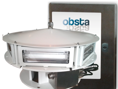
1966535B1 & US 7816843