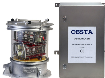
Brevets: EP 1966535B1 & US 7816843