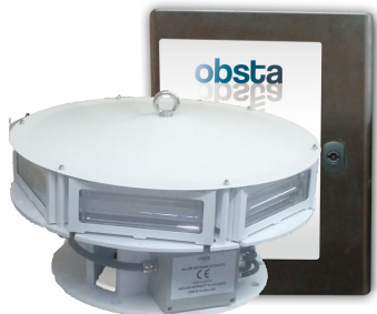
EP 1966535B1 &amp; US 7816843